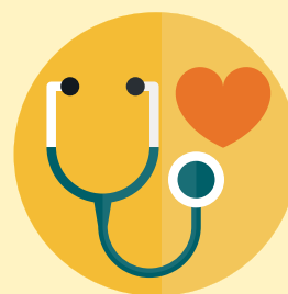
額外公共交通工具 意外每日住院現金權益