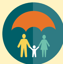
愛屋及鳥兼享優惠