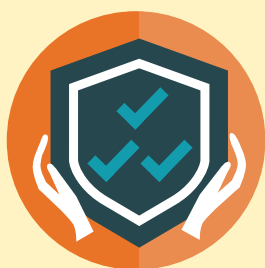
10種計劃級別 可供選擇