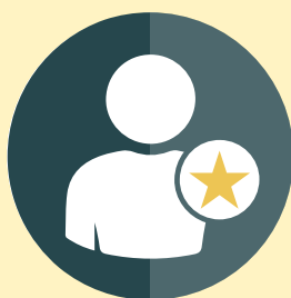
額外意外每日住院 現金權益